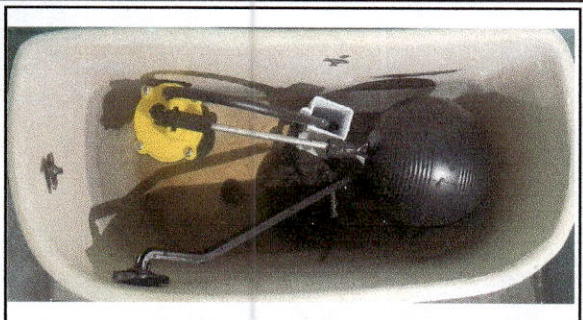
FOTO 2: Sustitución de accesorios inodoro (contra llave, tubo de abasto y tanque)